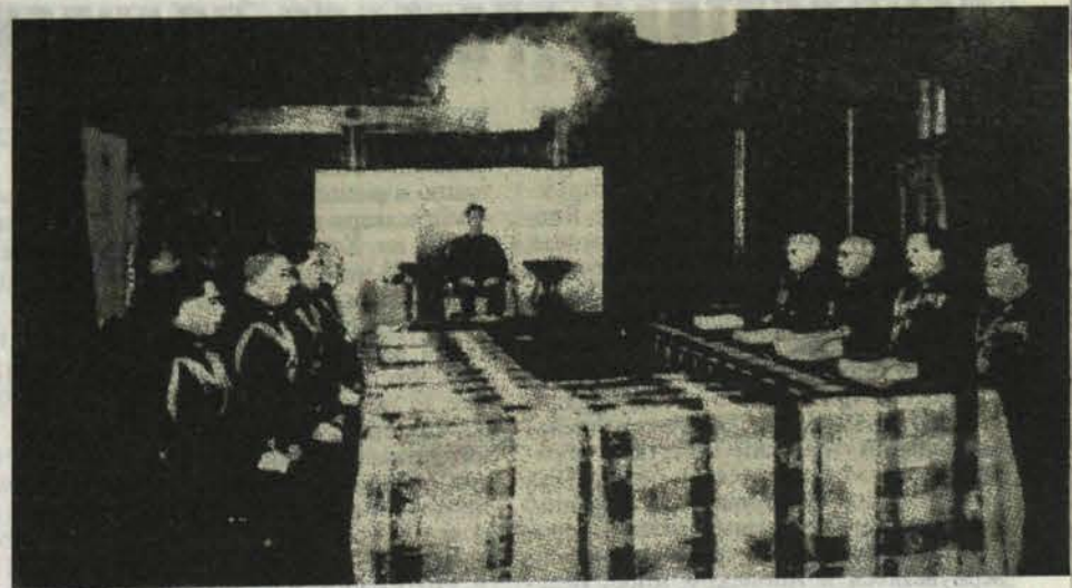
Здесь принимались решения о дальнейшем ведении войны Японией. На снимке: заседание ставки во главе с императором. Токио, 20 марта 1943 г.

Однако, если на суше дела развивались блестяще, на море американцев ждало серьёзное испытание. В проливе, отделявшем Гуадалканал от острова Флорида, находились многочислен-