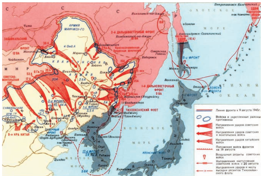
Раагрон Квантуноской армий Япони. 9 августа — 2 сентябрь 1945 г.