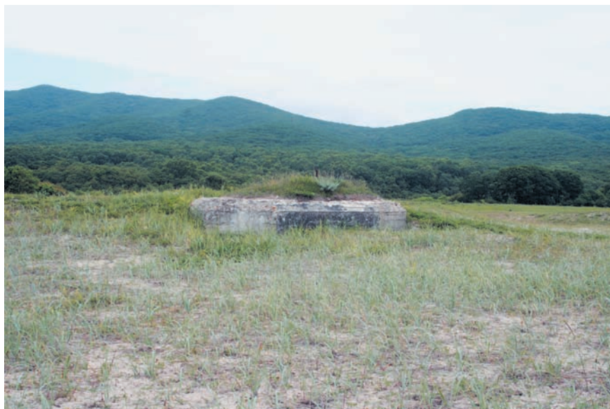
Рис. 4. Советский ДОТ на побережье Японского моря. Август 2014 г.