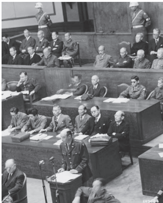
Рис. 12. Адвокат – капитан армии США Джордж Фернесс (George A. Furness) выступает на Токийском процессе

в том числе и Ёсуге Масуоку, так обласканный Иосифом Виссарионовичем при прощании в Москве. 13 человек были помилованы в 1955 г. Кроме Международного военного трибунала для Дальнего Востока, проходившего в Токио с 3 мая 1946 г. по 12 ноября 1948 г., был еще Хабаровский процесс. Обвиняемым вменялось в вину создание в Квантунской армии специальных подразделений (отряд 731, отряд 100), занятых разработкой бактериологического оружия (БО), в частности, разведением бактерий чумы, холеры, сибирской язвы и других тяжелых заболеваний, проведение экспериментов над людьми, использование БО против населения Китая. Вина всех обвиняемых была доказана в ходе процесса, и всем им, с учетом степени виновности, были назначены наказания в виде различных сроков лишения свободы. К смертной казни не был приговорен никто, поскольку смертная казнь в СССР была отменена в 1947 г.