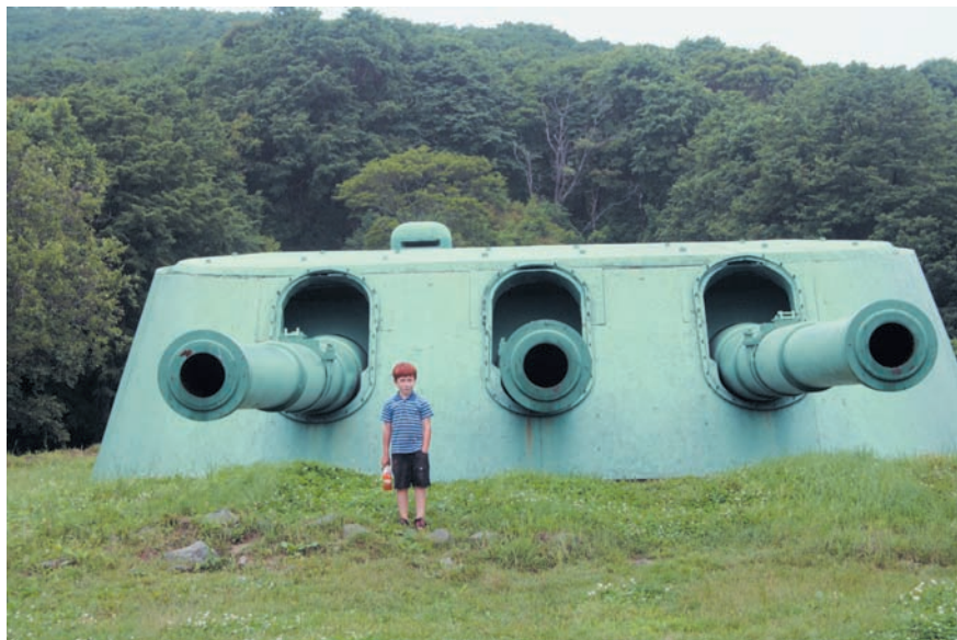
Рис. 5. Артиллерийские орудия Ворошиловской батареи на острове Русский в районе Владивостока. Август 2014 г.

скрыт внутри горного массива и тщательно замаскирован. По команде открывались огромные ворота, мгновенно вылетали самолеты, и ворота тут же закрывались. По возвращении самолетов ворота снова открывались и самолеты вновь скрывались в горе. Советские летчики уничтожили этот аэродром, что позволило значительно уменьшить потери наших войск.