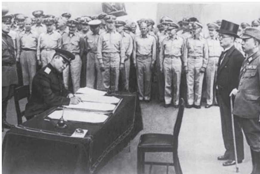
Рис. 11. Генерал-лейтенант К. Н. Дервянко – человек, подпись которого завершила Вторую мировую войну

От Советского Союза подпись под Актом поставил генерал К. Н. Дервянко (рис. 11), вся церемония совершилась за 20 минут. Так закончилась Вторая мировая война – самый трагический период в истории XX века.