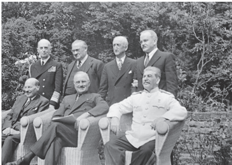
Рис. 2. Потсдамская конференция. Сидят: Клемент Эттли (премьер-министр Великобритании), Гарри Трумэн и Иосиф Сталин. Стоят: адмирал У. Д. Леги (США), Э. Бевин (министр труда Великобритании), Д. Бирнс (гос. секретарь США), В. М. Молотов (министр иностранных дел СССР)

Единственная сила на востоке, которая оставалась вне японского конфликта, – это СССР, так как номинально существовал Пакт о ненападении. Это была единственная возможность для мирного