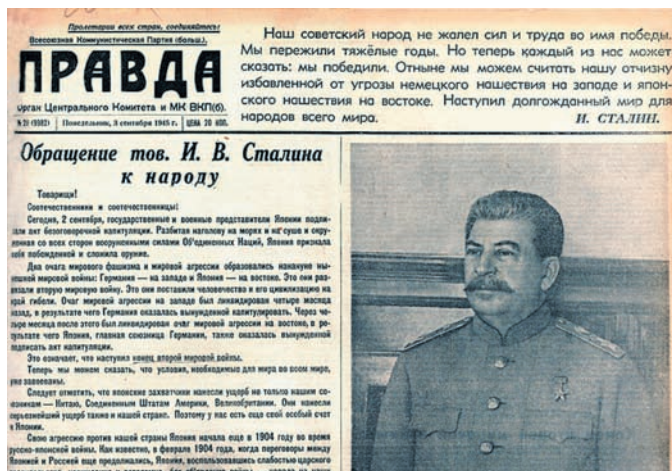
Рис. 9. Обращение Сталина к советскому народу