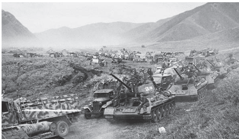
Рис. 7. Советские танки. Хинган