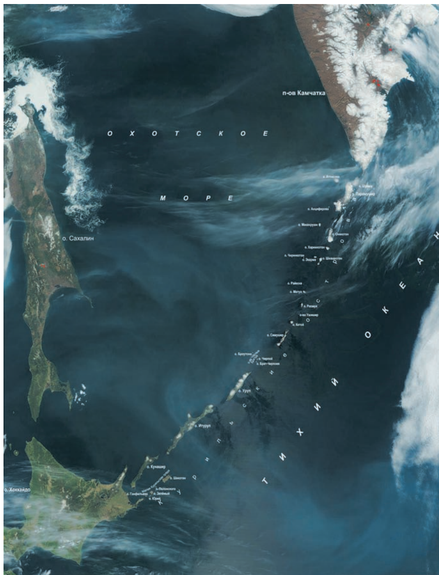
Рис. 8. Курильская гряда. Вид из космоса