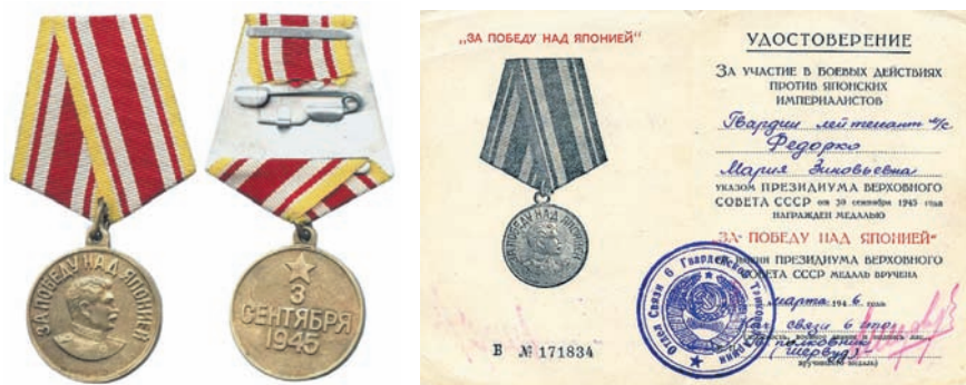
Рис. 10. Медаль “За победу над Японией”