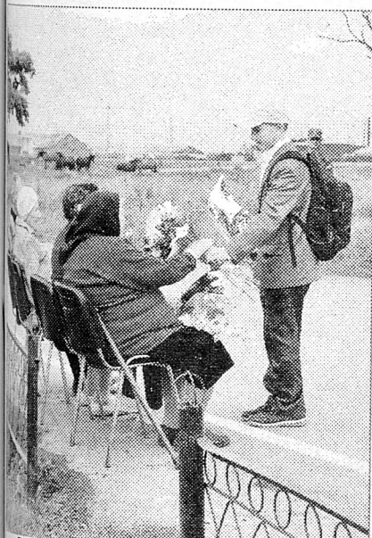
В митинге приняли участие ветераны трудового фронта