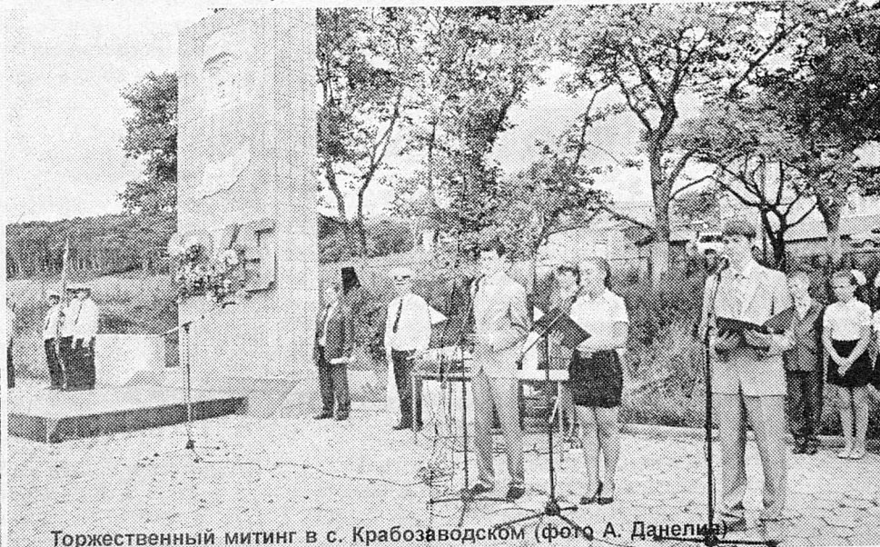
Торжественный митинг в с. Крабозаводском

рил от японского милитаризма, также собрались жители села и военнослужащие подразделения морских пограничных сторожевых кораблей Службы в р.п. Южно-Курильске.