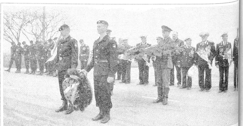
Возложение венков к памятнику Воину-освободителю