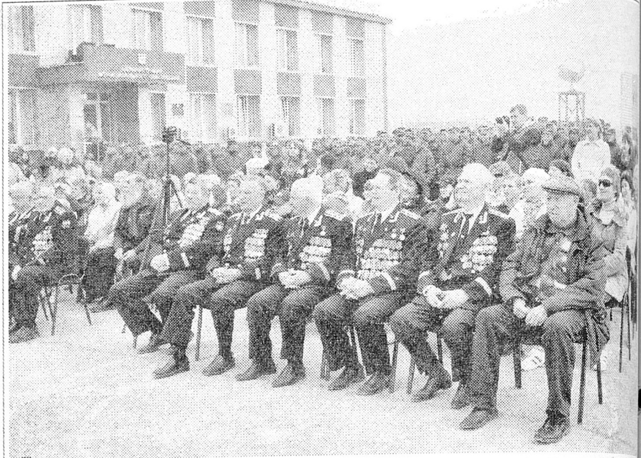
Вот они – ветераны Великой Отечественной и ветераны Тихоокеанского флота России