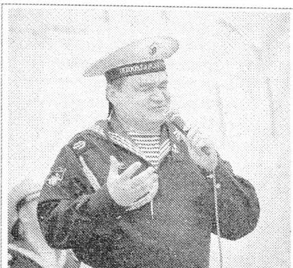
Поэт народный артист России Игорь Волков

В Южно-Курильском морском порту гостей – ветеранов Великой Отечественной войны, ветеранов Тихоокеанского флота хлебом-солью встретили представители общественности Южно-Куриль-