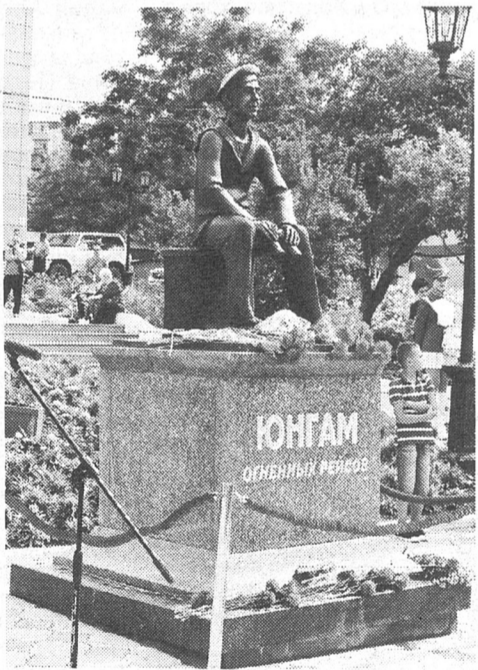
Памятник юнгам огненных рейсов.

Сломив упорное сопротивление японцев на Камышовом перевале, первая группа к вечеру 22 августа подошла к Осака (Пятиречье), откуда вскоре прибыли японские парламентарии. Вторая группа встретила упорное сопротивление японцев в районе Чертова моста и разьезда Икенохата, где бои шли 21 и 22 августа, но сломить сопротивление японцев не удалось. В ночь на 23 августа противник оставил обороняемые позиции и отступил. После капитуляции японцев в Осака к вечеру 23 августа бригада беспрепятственно овладела городом Рутака (Анива), а 24 августа вошла в Тоёхара и Одомари (Южно-Сахалинск и Корсаков).