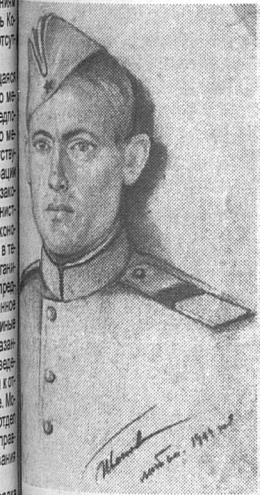
...А. Шилова, ...сованный его ...полчанином. 1944 г.

...нению молодых лю- ... поавших на фронт ... после школы. Юно- ... девушки только вче- ... стоили планы на но- ... мь, а вместо этого ... навстречу опасно- ... сти, сталкиваясь ... человекными и жес- ... ткими силами фашизма. ... ные испытания, вы- ... е на долю нашей ... страдальной Родины ... это испытания всего ... а и отдельно взято- ... го человека. Нет семьи, ... ую бы ни затронула ... яя Отечественная ... а всеобщая беда. ... может ли поиск но- ... териалов о той да- ... войне в наше вре- ... да прошли уже де- ... лет? Задумалась об ... В моей семье бе- ... хранится память о ... отважных, достой- ... живших интерес- ... ных.