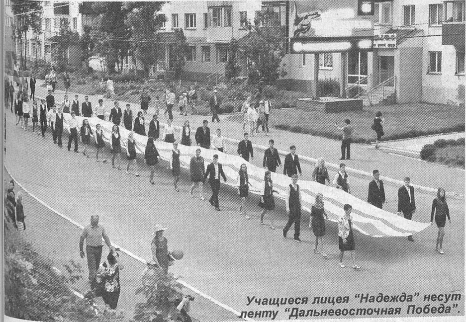
Учащиеся лицея «Надежда» несут ленту «Дальневосточная Победа».

ставители предприятий и организаций и другие. 30-метровую ленту «Дальневосточная Победа» пронесли лицеисты «Надежды».