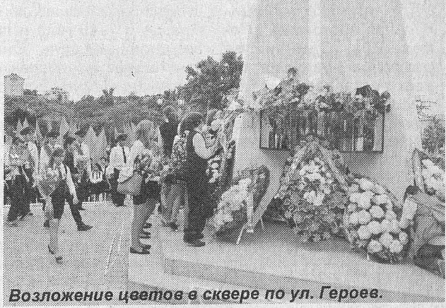
Возложение цветов в сквере по ул. Героев.