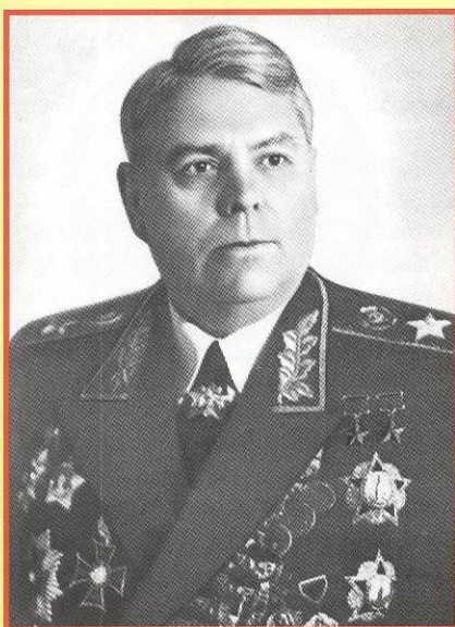
Александр Михайлович Василевский