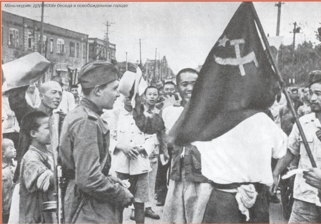
Маньчжурия: дружеская беседа в освобожденном городе

восточные фронты, с войсками которых должны были взаимодействовать 9-я, 10-я и 12-я воздушные армии, а также силы Тихоокеанского флота и Краснознаменной Амурской военной флотилии. Противовоздушную оборону осуществляли Приморская, Приамурская и Забайкальская армии ПВО страны. Пограничным войскам Приморского, Хабаровского и Забайкальского пограничных округов предстояло в ходе фронтовых операций ликвидировать пограничные кордоны и посты противника, уничтожить его укрепленные опорные пункты, а впоследствии принять участие в преследовании вражеских войск и охране коммуникаций, штабов и тыловых районов. Всего на Дальнем Востоке против японских вооруженных сил было развернуто 11 общевойсковых, танковая и 3 воздушные армии, 3 армии ПВО страны, флот и флотилия. Сухопутную границу СССР прикрывал 21 укрепленный район. Советские и монгольские войска и силы флота насчитывали на Дальнем Востоке более 1,7 млн. человек, около 30 тыс. орудий и минометов (без зенитной артиллерии), 5,25 тыс. танков и самоходных артиллерийских установок, 5,2 тыс. самолетов, 93 боевых корабля основных классов. В ходе боевых действий прибыли 3-й гвардейский механизированный и 126-й легкострелковый корпуса.