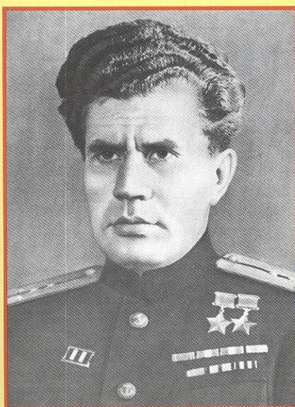
Виктор Николаевич Леонов