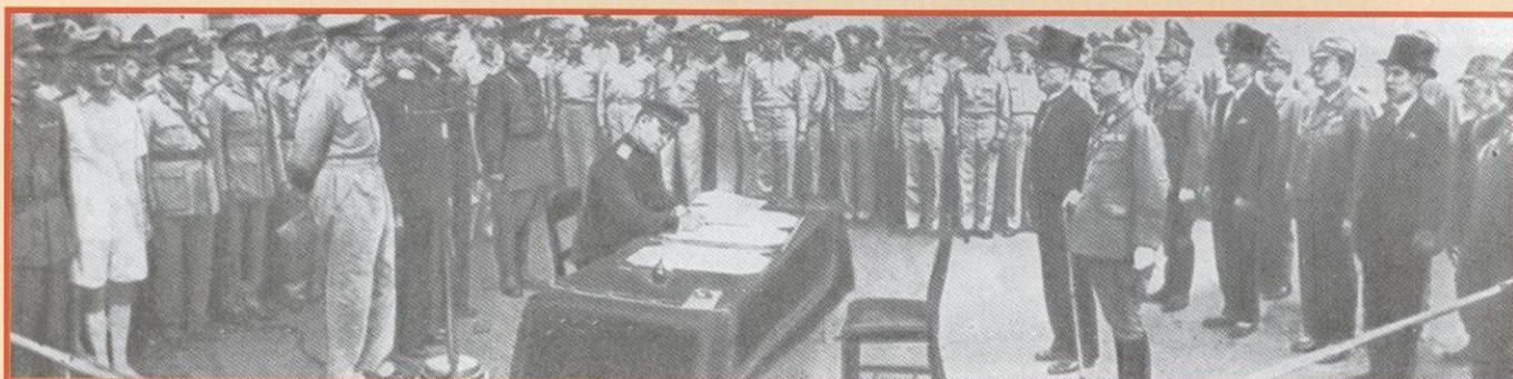
Генерал-лейтенант К.Н. Деревянко от имени Советского Союза подписывает Акт о капитуляции милитаристской Японии

Победа над фашистской Германией в мае 1945 года означала окончание Великой Отечественной войны Советского Союза 1941-1945 годов и вместе с тем окончание войны в Европе. Но на Востоке она еще продолжалась. В Азиатско-Тихоокеанском регионе шла борьба между Японией и США, Великобританией и их союзниками. Война на Востоке могла затянуться еще на 1,5-2 года и унесла бы с собой жизни миллионов людей.