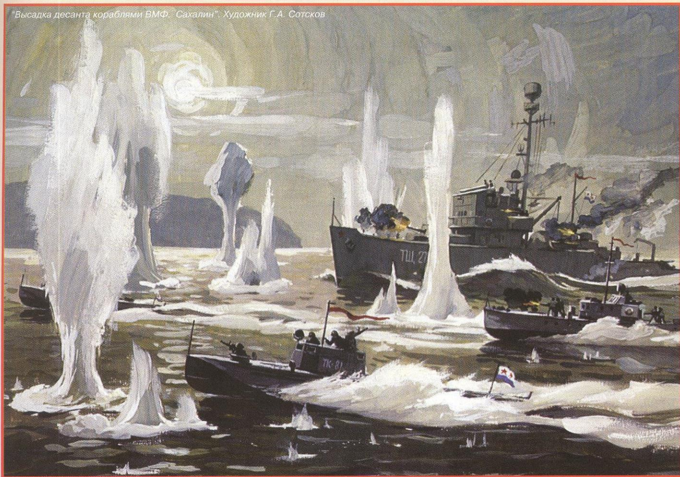
"Высадка десанта кораблями ВМФ. Сахалин". Художник Г.А. Сотсков

хоокеанскую военную флотилию. Южный Сахалин обороняла входившая в состав 5-го фронта со штабом на о. Хоккайдо усиленная 88-я японская пехотная дивизия, опиравшаяся на Котонский укрепленный район протяженностью 12 км по фронту и до 30 км в глубину. Боевые действия на Сахалине начались прорывом укрепленного района. Советским войскам пришлось действовать в сложных условиях лесисто-болотистой местности. Наступление велось вдоль единственной фунтовой дороги, связывавшей Северный Сахалин с Южным и проходившей между труднодоступными отрогами гор и заболоченной долиной реки Поронай. 16 августа в тыл противника в порт Торо (Шахтерск) был высажен морской десант.