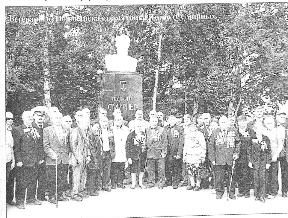
Ветераны из Поронайска у памятника Герою Смирных

Без сомнения, эти места не видели столько людей. Сотни и сотни пришли,