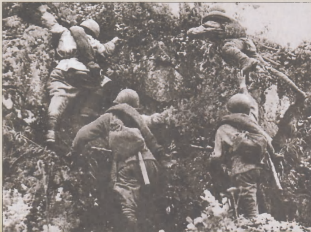
1-й Дальневосточный фронт в наступлении. Бойцы Красной Армии карабкаются на сопки. Трудные условия местности были одной из характерных черт боевых действий на Дальнем Востоке