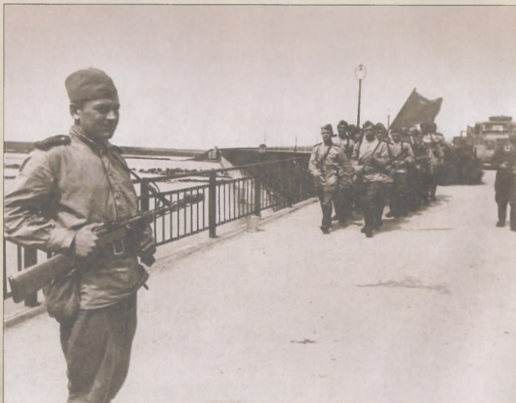
Красноармейцы на мосту через реку в Маньчжурии

Из-за размытых дождями дорог единственным маршрутом для наступления 6-й гвардейской танковой армии стала железная дорога. Двухдневный марш по шпалам превратился в тяжелейшее испытания для техники и людей — любая поломка приводила к остановке всей колонны. В этой ситуации вставшие танки просто