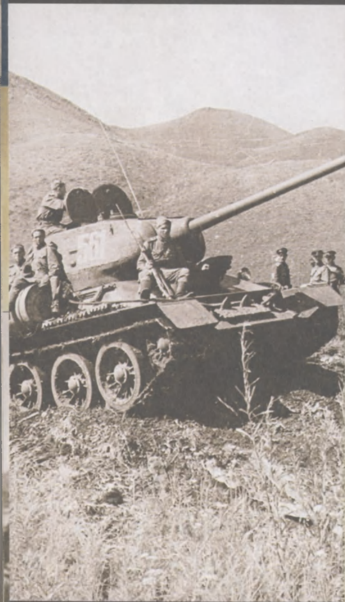
Советские средние танки Т-34-85 преодолевают хребет Большой Хинган. Маньчжурия, август 1945 г.

При беглом взгляде на карту театра военных действий его размеры поражают: только Маньчжурия по площади была равна Германии и Италии, вместе взятым. Более того, центральная равнинная часть этого региона была подобна крепости, окруженной естественным «валом» из горных хребтов. Однако задействовать против японцев те же силы, что сокрушали Третий рейх, было невозможно. Дальневосточный регион Советского Союза был связан с остальной страной небольшим количеством дорог ограниченной пропускной способности. Снабжать крупную военную группировку по этим дорогам было невозможно. Также бедной и слабой была дорожная сеть самой Маньчжурии.