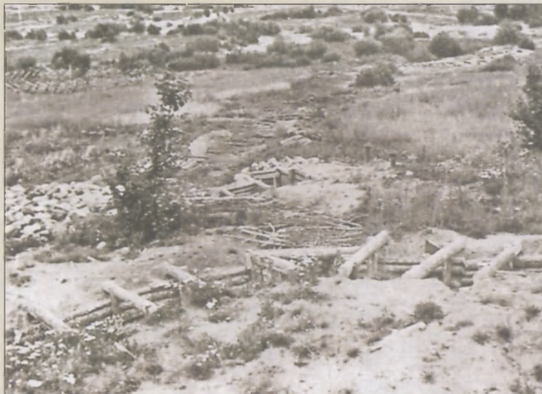
Японские окопы. Маньчжурия, август 1945 г.

Первые известия о начавшемся советском наступлении не вызвали смены курса японского руководства. Император, являвшийся главой вооруженных сил Страны восходящего солнца, 9 августа отдал Квантунской армии приказ: «Вести упорную оборону в районах, фактически занимаемых японскими войсками, и готовить военные операции большого масштаба, которые будут проведены по плану Ставки». Однако плохие новости следовали одна за другой. Через два дня после американской атомной бомбардировки Хиросимы стертый от взрыва с лица земли город осматривала правительственная комиссия. Обещанные союзниками «окончательные удары» произвели шокирующее на руководителей Японии впечатление. На заседании Высшего военного совета премьер-министр Судзуки, заявил: «Мы полу-