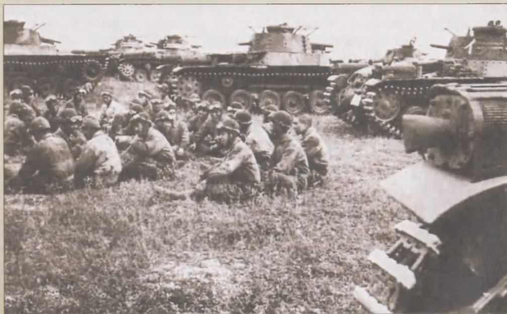
На учениях 23-го танкового полка Квантунской армии в Маньчжурии. Полк вооружен танками «Чи-ха»