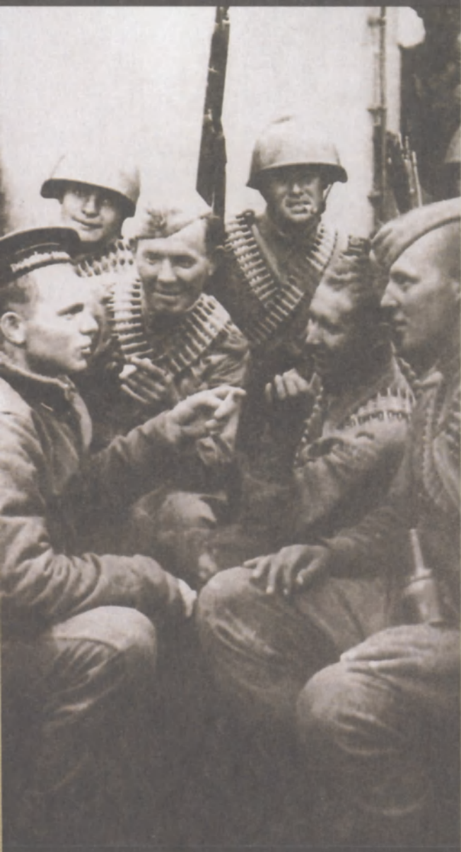
Советские бойцы на палубе транспортного корабля во время перехода к острову Шумшу. Курильская десантная операция, август 1945 г.

Согласно договоренностям с союзниками, Советский Союз соглашался вступить в войну с Японией на условиях получения взамен островов Курильской гряды, Ожого Сахалина, а также на оккупацию острова Хоккайдо. Однако уже 14 августа, в день объявления императором Хирохито капитуляции Японии, стало известно, что планы изменились. Командующий американскими войсками на Тихом океане генерал Дуглас Макартур получил приказ о недопущении повторения германского сценария с зонами оккупации. Красной Армии нужно было отстоять свое право на острова с оружием в руках. В этих условиях дорог был каждый час, и решение советским командованием было принято незамедлительно. В ночь на 15 августа А.М. Василевский отдал распоряжение провести операцию по овладению Курильскими островами. Ранним утром командующий Камчатским оборонительным районом получил приказ из штаба 2-го Дальневосточного фронта по подготовке десанта на острова Шумшу, Парамушир и Онекотан. Первоначально корабли с десантом должны были выйти в море уже в шесть вечера того же дня. Однако несколько часов на все подготовительные мероприятия было слишком мало. Выход в море сместили на сутки.