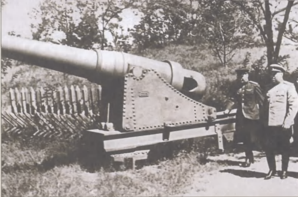
Маршал А.М. Василевский в Порт-Артуре осматривает орудие времен Русско- японской войны 1904–1905 гг.

тулировать только специальные делегации из штаба Квантунской армии в сопровождении советских офицеров. Всего в плен войскам трех дальневосточных фронтов сдались 594 тысячи офицеров и солдат, в том числе 148