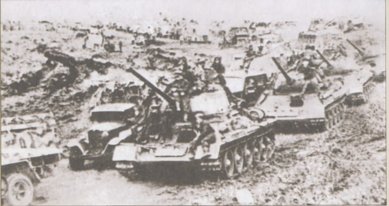
Советская 6-я гвардейская танковая армия вышла с горных хребтов на равнины Маньчжурии. Август 1945 г.

юзники согласятся не включить в нее пункта о лишении императора суверенных прав». Через нейтральную Швейцарию это предложение было передано союзникам, но было ими отклонено. От Японии и ее монарха требовали безоговорочной капитуляции. В итоге 12 августа токийское радио передало сообщение: «Императорская армия и флот, выполняя высочайший приказ <...> повсеместно перешли к активным боевым действиям».