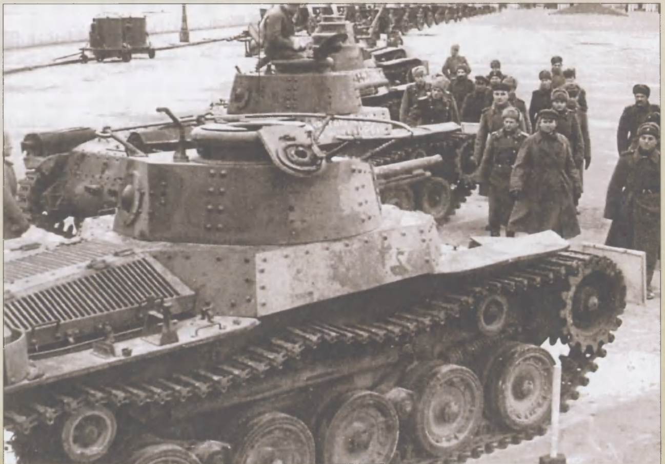
«И на Тихом океане свой закончили поход...» Японские трофейные танки «Ха-го» на берегу Желтого моря. Август 1945 г.

японских генералов. Только 6-я гвардейская танковая армия взяла в плен и разоружила 125 тысяч человек, в том числе 27 генералов. При этом армия А.Г. Кравченко потеряла всего 20 человек убитыми.