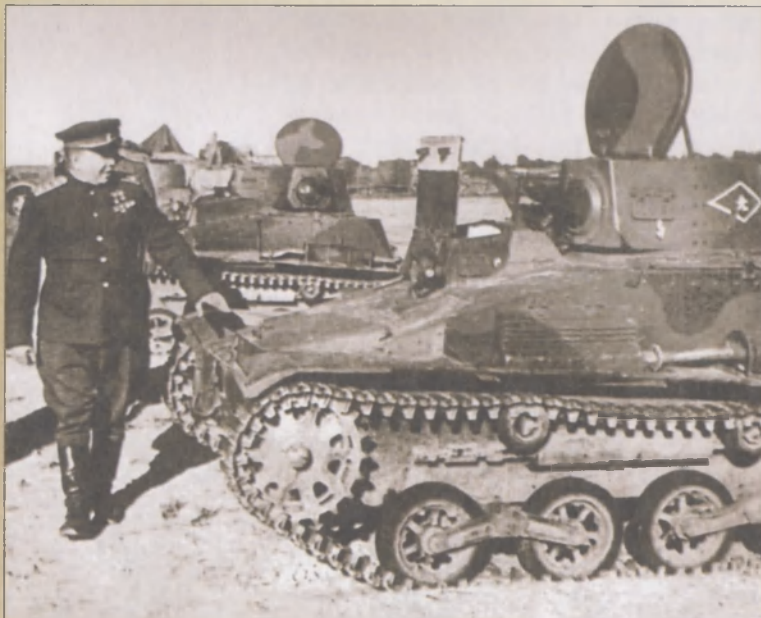
Командующий 1-й Краснознаменной армией А.П. Белобородов осматривает трофейные японские танкетки Тип 94. 1945 г.

действий еще не отдан, и японские вооруженные силы по-прежнему продолжают сопротивление. Следовательно, действительной капитуляции вооруженных сил Японии еще нет».