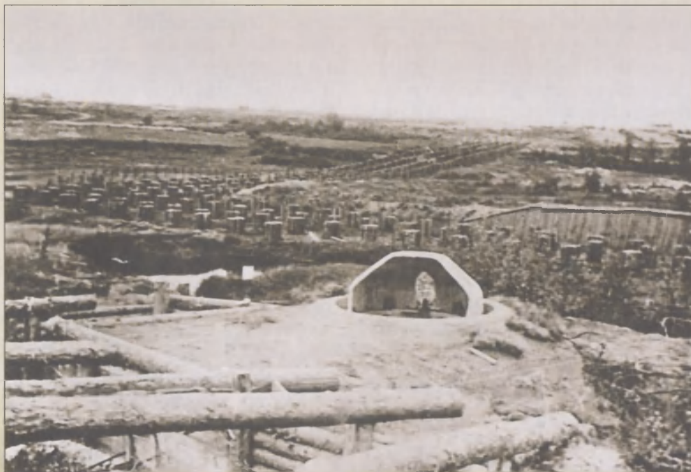
Захваченные войсками 1-го Дальневосточного фронта японские укрепления, прикрывающие противотанковые надолбы. Маньчжурия, август 1945 г.

чили огромное потрясение от атомной бомбы, сброшенной на Хиросиму. Вступление сегодня утром в войну Советского Союза ставит нас окончательно в безвыходное положение и делает невозможным дальнейшее продолжение войны. Не следует ли нам немедленно принять условия Потсдамской декларации?» Вечером совещание продолжилось в присутствии императора. Оно шло всю ночь и закончилось только в 10 часов утра 10 августа. Японское правительство решило принять условия Потсдамской декларации в том случае, если «со-