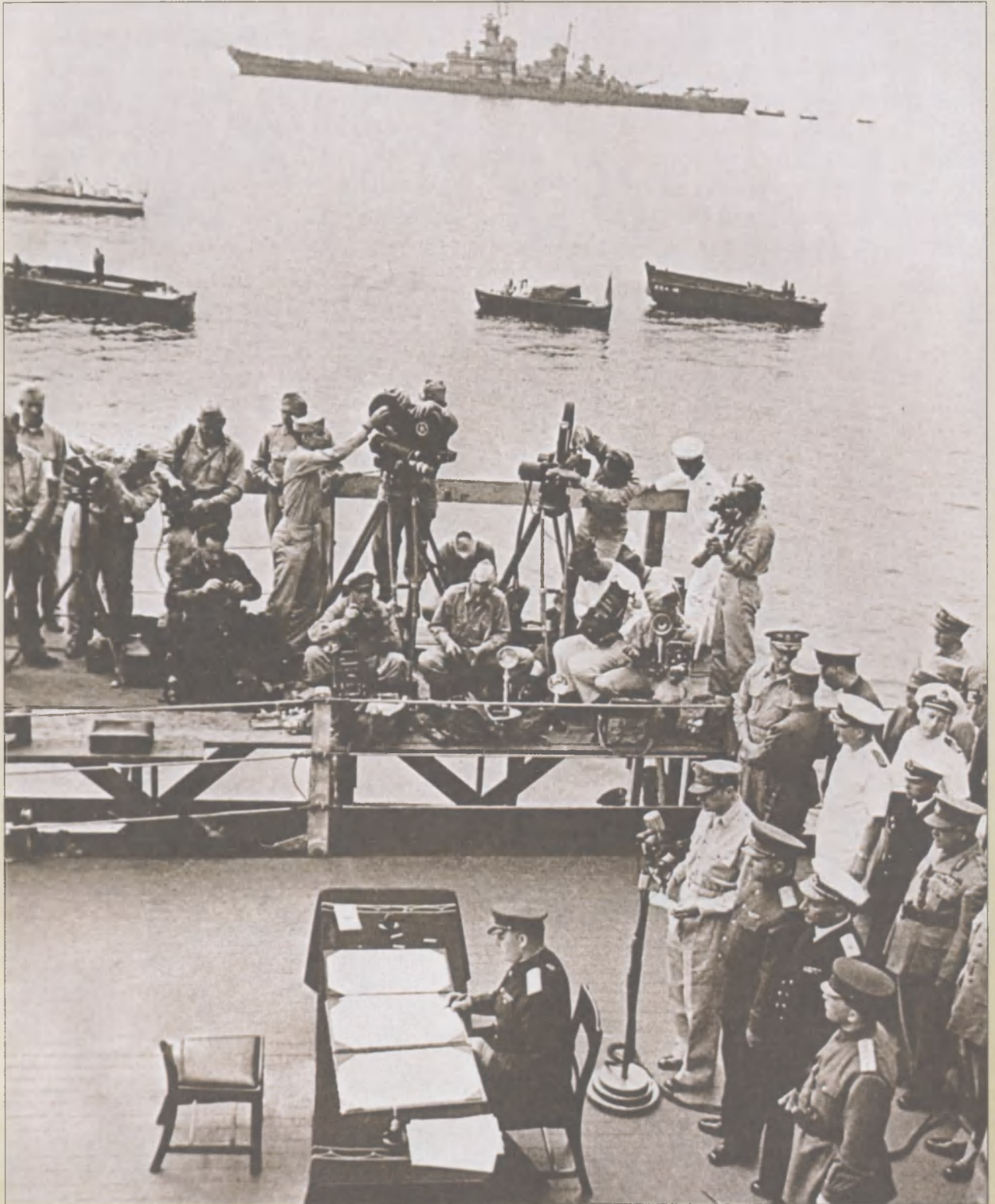
Генерал-лейтенант К. Н. Дервянко от лица Советского Союза подписывает Акт о капитуляции Японии на борту американского линкора «Миссури», Токийский залив, 2 сентября 1945 г. На заднем плане линкор ВМС США «Айова»