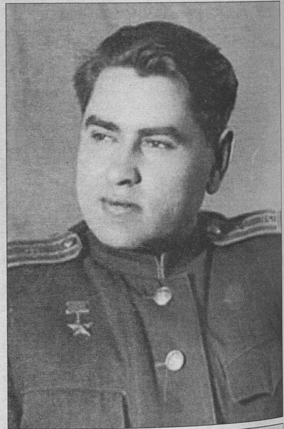
На снимке: Алексей Маресьев.

ря 1942 года он также успешно выполнил задание – разбомбил важный стратегический объект в тылу врага, но самолет