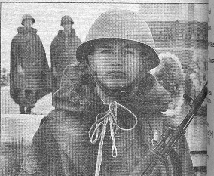
Никто не забыт! Ничто не забыто!