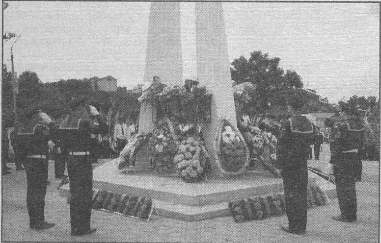
На церемонии празднования 70-й годовщины окончания Второй мировой войны. 2015 г.