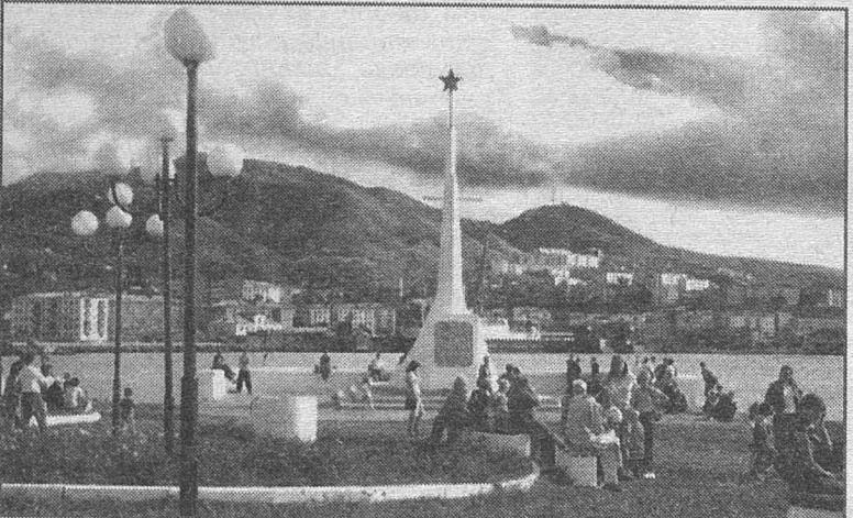
В год открытия памятника на Приморском бульваре.