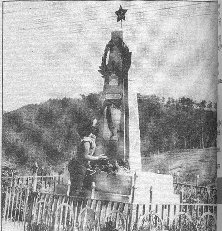
Так выглядел памятник на братской могиле воинов-освободителей на Холмском перевале. 60-е годы.