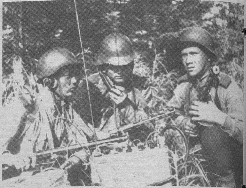
Советские пехотинцы на о. Сахалин.