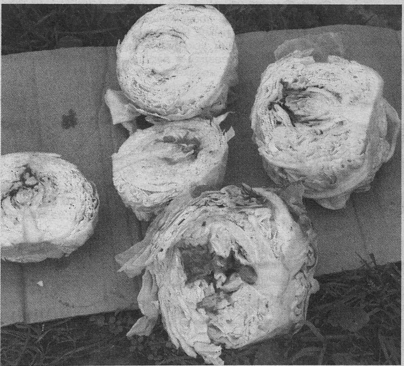
Этим гнильем ООО «Катюша» предлагает кормить школьников.

7.2. В случае обнаружения недопоставки или несоответствия товара условиям о качестве поставщик обязуется восполнить недостающий товар или произвести замену некачественного товара за свой счет и сво-