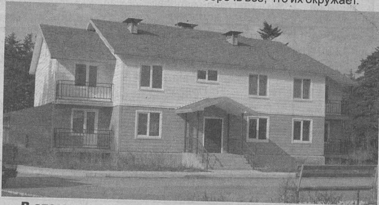
В этом доме предоставлены квартиры двум педагогам.

Стараются, конечно, относиться бережно, но не всегда получается. С маленькими, так сказать, аварийными ситуациями мы справляемся. Со школьниками проводим воспитательные беседы, объясняем: нужно беречь всё, что их окружает.