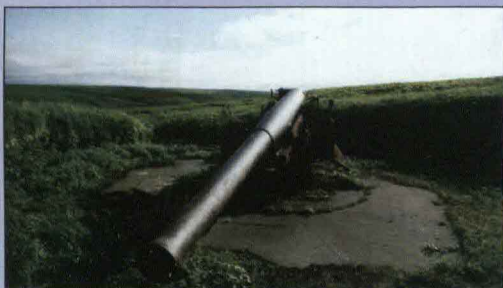
Японское оборонительное орудие