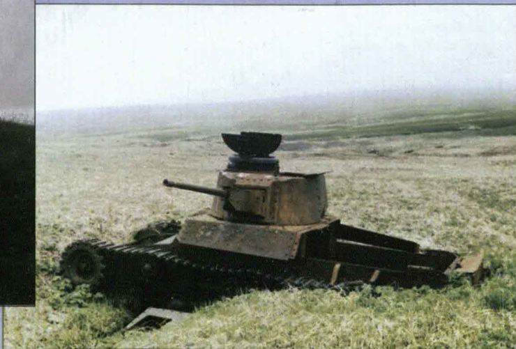
Японский средний танк «Чи-ха»

Всего в ходе операции было взято в плен до 60 тыс. солдат и офицеров, захвачено свыше 300 орудий и миномётов, 60 танков и около тысячи пулемётов.