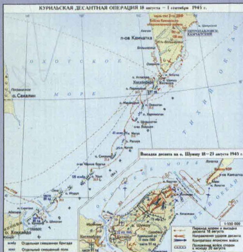
Курильская десантная операция