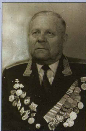
▲ Генерал-майор П.И. Дьяков