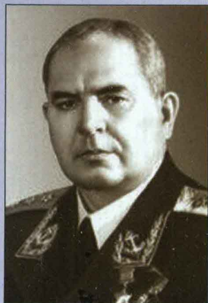
▲ Адмирал И.С. Юмашев

освобождения Курильских островов от японцев