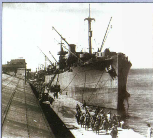
▲ Начало Курильской десантной операции — посадка десанта