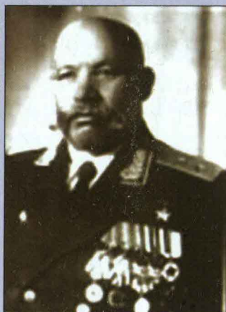
▲ Генерал-майор А.Р. Гнечко