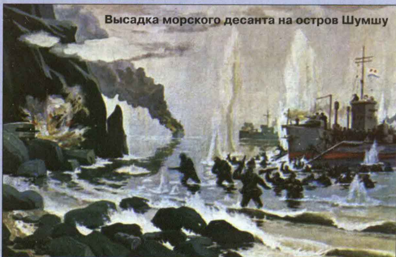
Высадка морского десанта на остров Шумшу