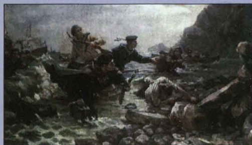
Десант на Курильских островах Художник А.И. Плотнов