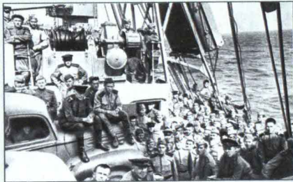
▲ Советские войска направляются на Южный Сахалин