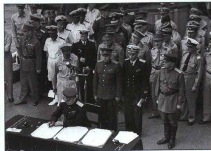
▲ Представитель СССР генерал К.Н. Деревянко подписывает Акт о капитуляции Японии на американском линкоре «Миссури»