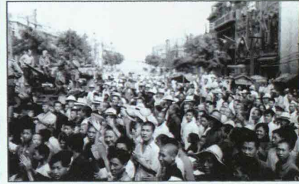
▲ Китайское население приветствует советских танкистов, вступивших в г. Дальний (Далаян) Фото Е. Халдея, сентябрь 1945 г.