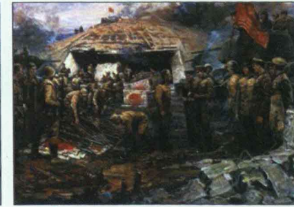
▲ Капитуляция Квантунской армии. 1945 год Художник М.А. Ананьев, 1988 г. Студия военных художников имени М.Б. Грекова

Акт о капитуляции Японии. Стороны, подписавшие акт: Япония, СССР, США, Китай, Великобритания, Франция, Канада, Австралия, Новая Зеландия, Нидерланды