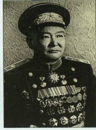
▲ Х. Чойбалсан

148 японских генералов, 594 тыс. офицеров и солдат. К 5 сентября 1945 года успешно завершили операции по освобождению советскими войсками Южного Сахалина и Курильских островов.