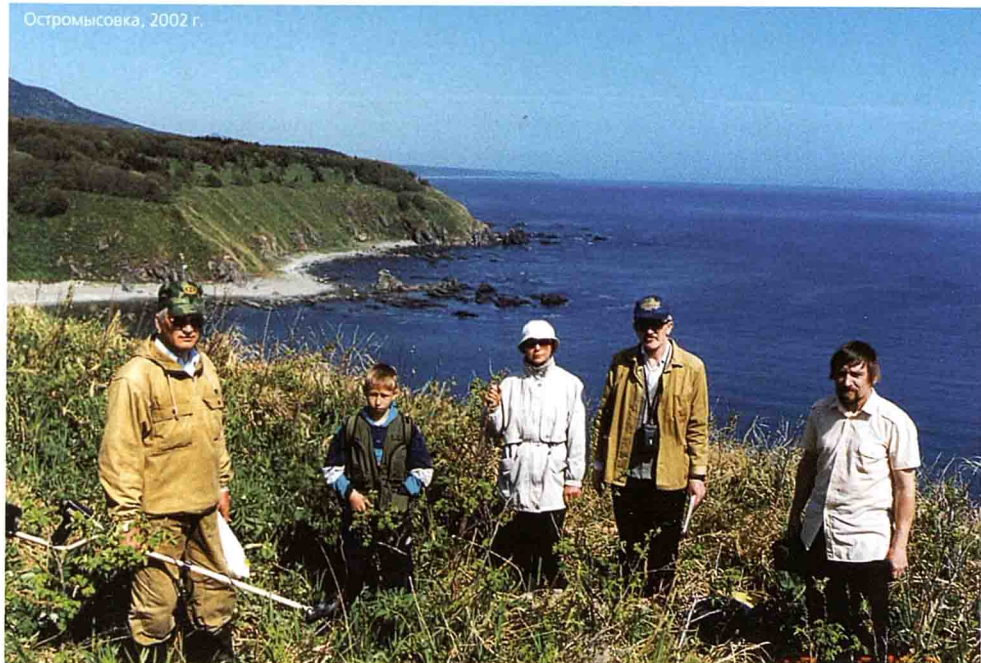
Остромысовка, 2002 г.

Еще я хочу опубликовать книгу своих стихов и песен и приложить туда диски.