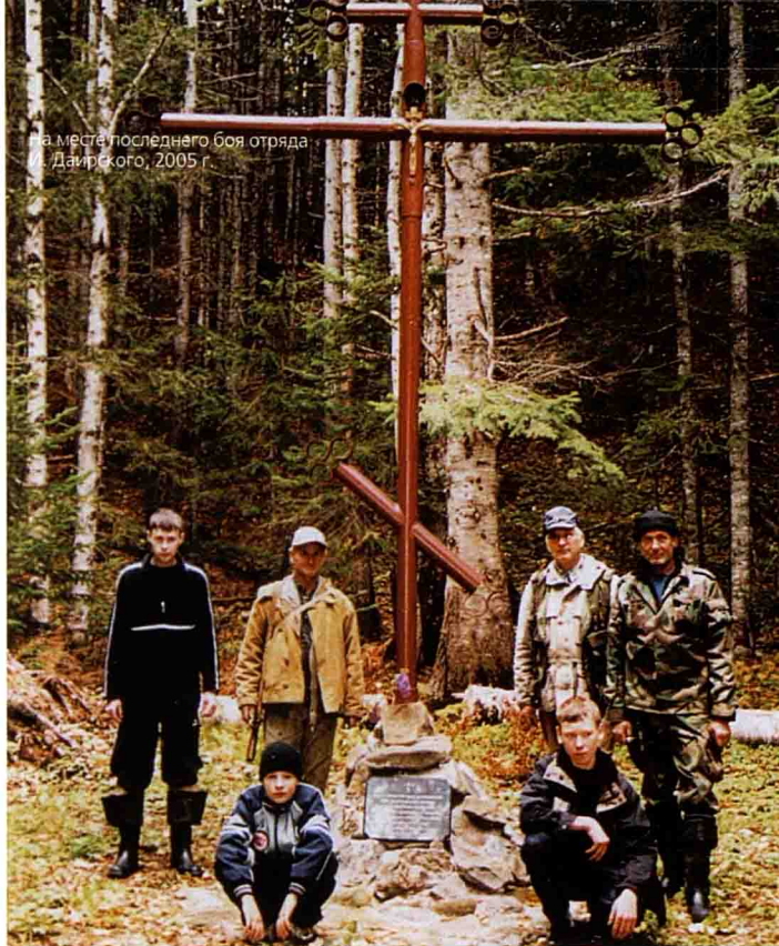
на месте последнего боя отряда Даирского, 2005 г.

– Попавших в плен дружинников японцы около 20 км вели по долине Найбы, а затем с особой жестокостью перекололи штыками. И это несмотря на то что на основном театре русско-японской войны к русским пленным относились как к «почетным