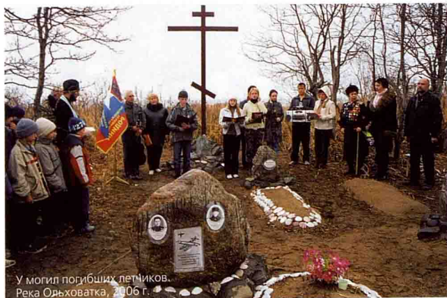
У могил погибших летчиков. Река Одьховатка, 2006 г.

– В своей поисковой работе вы используете метод биолокации, или лозоискательства. Сейчас он является общепризнан-