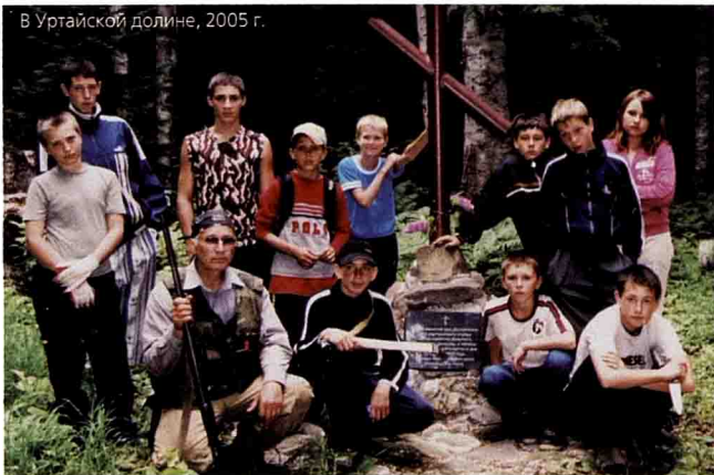
В Урттайской долине, 2005 г.