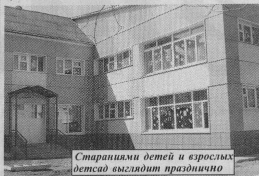
Стараниями детей и взрослых детсад готовится празднично

Про это нужно сказать. Большая подготовка к празднику, это не только концерты, вечера для ветеранов, поздравительные речи.