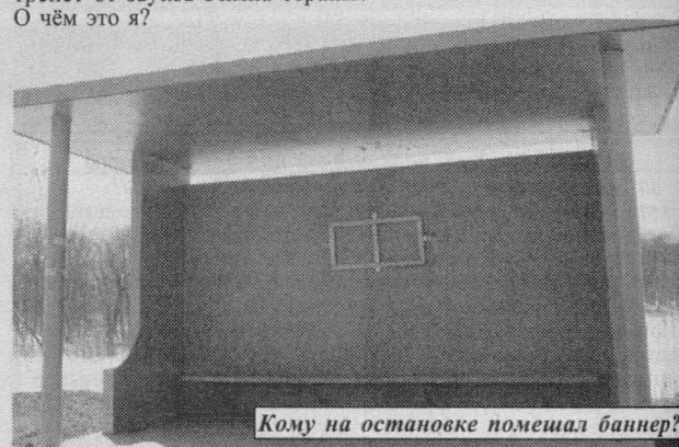
Кому на остановке помешал баннер?