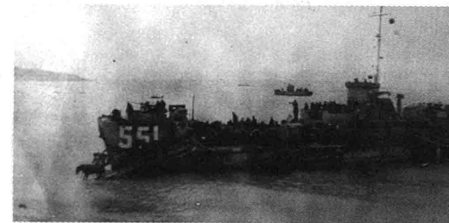
Десантные суда у о.Шумшу, 18 августа 1945 г.

В 5.00 17 августа суда с десантом вышли из Авачинской бухты и сквозь туман направились к цели. Командующий операцией из-за тумана перенес командный пункт на «ТЩ-334» и отменил высадку демонстративного десанта. Плохая видимость способствовала скрытности начала высадки. Японцы не ожидали, что ограниченные силы с Камчатки решатся на вторжение, поэтому высадка десанта