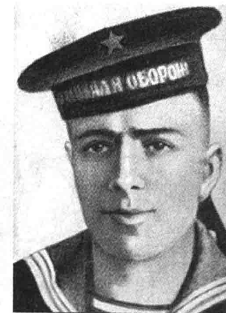
Герой Советского Союза П.И.Ильичёв

тить ту или иную часть своей территории и выражает готовность ввиду этого предоставить своему союзнику соответствующую базу. Я не думаю, чтобы Советский Союз можно было причислить к числу таких государств. В-третьих, так как в Вашем послании не излагается никаких мотивов требования о предоставлении постоянной базы, должен Вам сказать чисто-сердечно, что ни я, ни мои коллеги не понимаем ввиду каких обстоятельств могло возникнуть такое требование к Советскому Союзу» 5 .