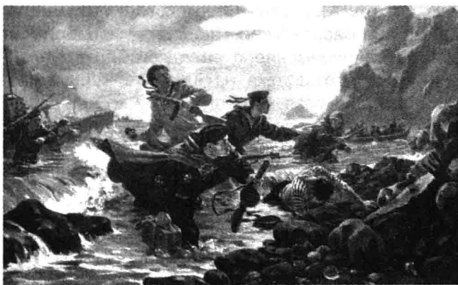
Высадка десанта на о. Шумшу. Художник А.Плотнов

15 августа Трумэн направил Сталину текст общего приказа Макартура. В одном из пунктов было указано, что японские силы на островах Рюкю,