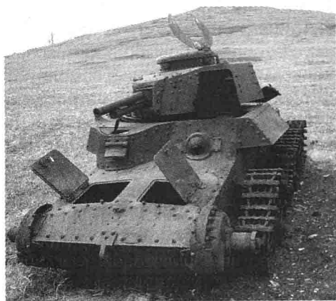
Подбитые японские танки на о.Шумшу можно встретить и сегодня

На совещании министров иностранных дел СССР, Англии и США в Москве (16–26 декабря 1945 г.) было решено учредить международную