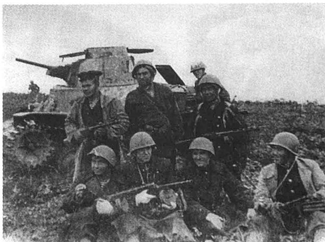
Участники десанта позируют на фоне японского танка

канских самолетов при чрезвычайных ситуациях в период оккупации Японии на одном из Курильских островов и, со своей стороны, предложил, чтобы такое право было признано за советскими коммерческими самолетами на одном из Алеутских островов, чтобы сократить воздушный путь на Сиэтл.