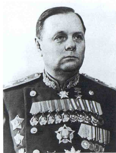
К. А. Мерецков