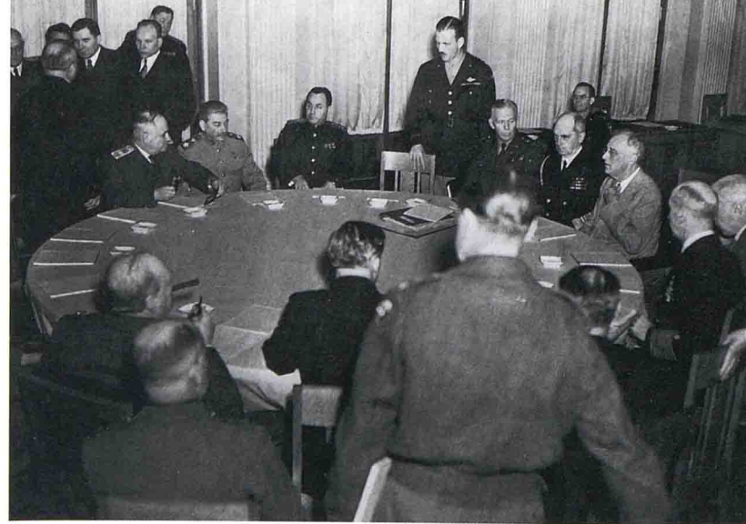
Лидеры «Большой тройки» за столом переговоров на Ялтинской конференции

в) совместная эксплуатация Китайско-Восточной железной дороги и Южно-Маньчжурской железной дороги, дающей выход на Дайрен, при сохранении полного суверенитета Китая над Маньчжурией;