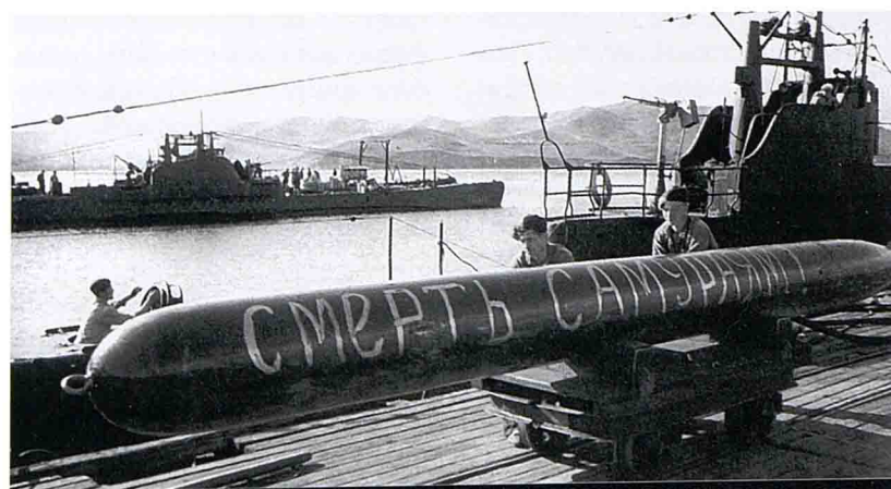
Погрузка торпеды на советскую подводную лодку

с запада на восток было переброшено свыше 403 тыс. военно-служащих, около 275 тыс. единиц стрелкового оружия, 7137 орудий и миномётов, 2119 танков и самоходных артиллерийских установок, 17 374 грузовые автомашины, около 1,5 тыс. тракторов и тягачей, свыше 36 тыс. лошадей. Сюда же прибыли управления 6-го бомбардировочного авиационного корпуса и 5-й авиационной дивизий, 3 корпуса ПВО. По пространственному размаху, срокам осуществления, количеству переброшенных войск, оружия, военной техники и материальных средств это была беспрецедентная в истории войн стратегическая перегруппировка. Всего на Дальнем Востоке было сосредоточено свыше 87 расчётных дивизий: более 1,7 млн человек, около 30 тыс. орудий и миномётов, свыше 5200 танков и самоходных артиллерийских установок, более 5 тыс. боевых самолётов. Кроме того, к участию в военных действиях против Японии планировалось привлечь силы Тихоокеанского флота, Краснознаменной Амурской военной флотилии, трёх армий ПВО и войска Монгольской народно-революционной армии во главе с маршалом Х. Чойбалсаном [3, с. 193].