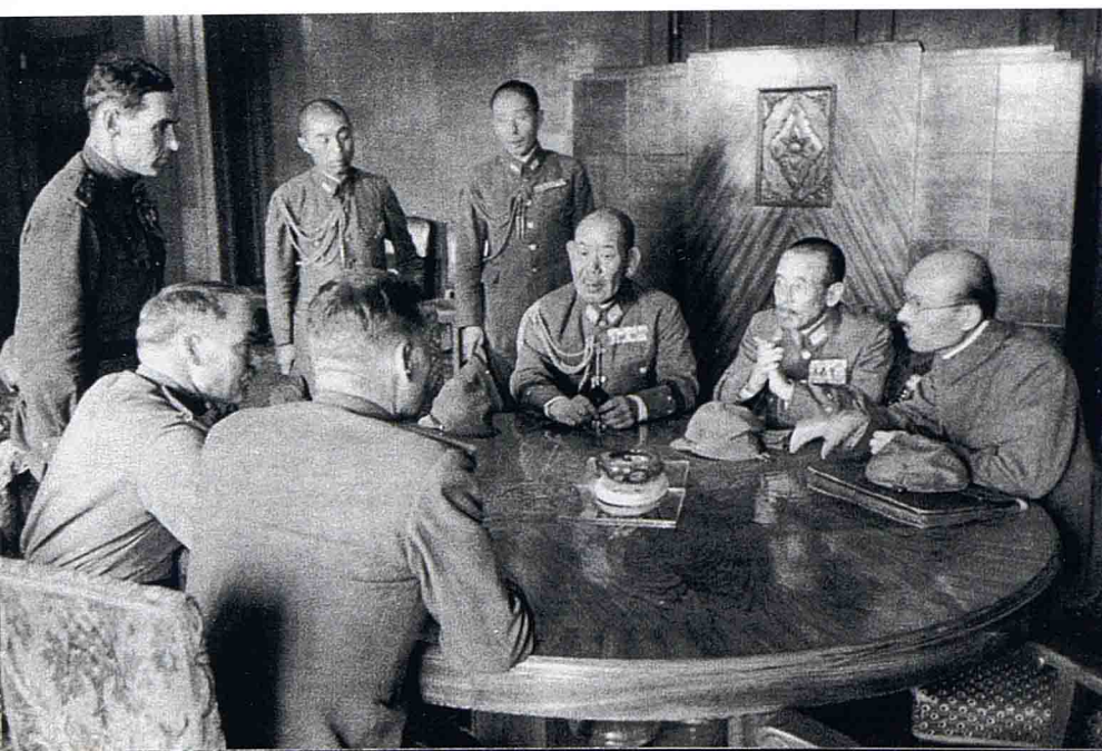
Переговоры о капитуляции Квантунской армии. 1 сентября 1945 г.