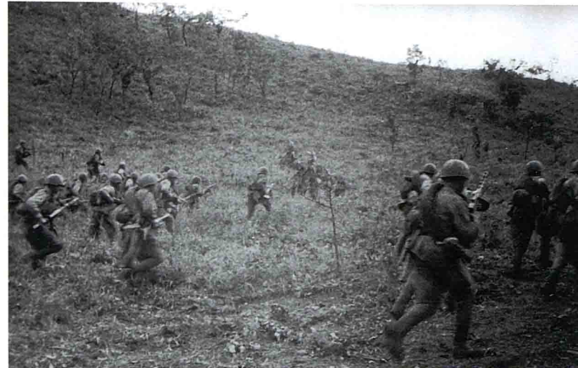
Войска 5-й армии 1-го Дальневосточного фронта переходят границу Маньчжурии. 9 августа 1945 г.

командование советских войск на Дальнем Востоке во главе с маршалом Советского Союза А. М. Василевским.