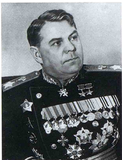
А. М. Василевский