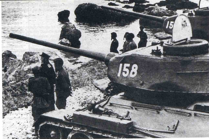
Танки Т-34 6-й гвардейской танковой армии на побережье Ляодунского залива

Блестящая победа далась не легко. Только в ходе Маньчжурской операции советские войска потеряли убитыми, ранеными, заболевшими и пропавшими без вести 36 456 человек. Правда, суммарные потери наступавшей Красной армии не превысили японские, даже без учёта пленных. Сказались боевой опыт и искусство советских полководцев и воинов, отточенные в сражениях с фашистской Германией.