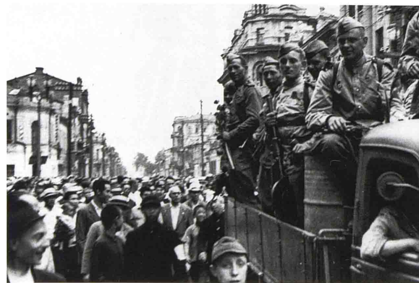
Советские войска в Харбине.

Операции были построены на принципе внезапного массированного удара. Его обеспечивали тщательная маскировка, наступательные действия ночью и в самых неблагоприятных погодных условиях, и к тому же на участках, которые противник считал непреодолимыми.