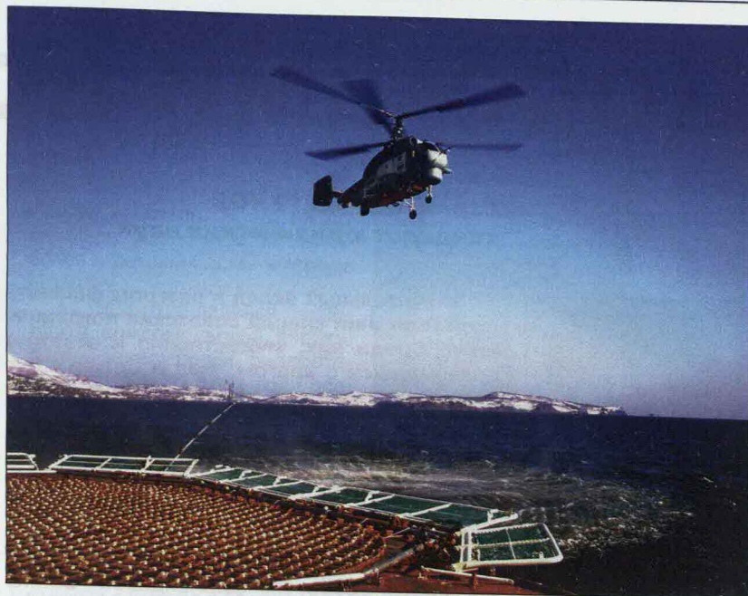
Вертолёт Ка-27 взлетает с палубы «Дзержинского».