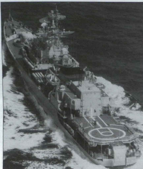
Краснознамённый пограничный сторожевой корабль «Дзержинский» третьего поколения, 1986 год.