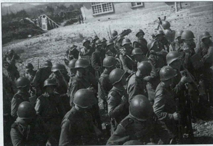
Сводная рота пограничников в порту Катаока.

В середине июля «Дзержинский» вышел из базы, держа курс на север. Продовольствие, обмундирование для отдалённой комендатуры и пассажиры, направлявшиеся на Чукотку, заняли большую часть помещений корабля. Некоторые из них успели добраться до мест назначения, другим пришлось экстренно выгружаться в бухте Провидения. Здесь ранним утром 9 августа застала сторожевик радиограмма-молния, требующая от «Дзержинского» срочно вернуться в Петропавловск-Камчатский. Из неё на корабле узнали, что Советский Союз объявил войну Японии. 1-й и 2-й Дальневосточные фронты, заблаговременно подготовленные к началу боевых действий, перешли границу, предварительно «зачищенную» стражами рубежей. Морским пограничникам в этот период предстояло интернировать японских рабочих и служащих концессионных промыслов, а также