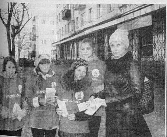
26 ноября – Всемирный день ребенка, в который воспитанники СПЦН «Огонёк» провели акцию, вручая детям и родителям буклеты-памятки о правах детей.