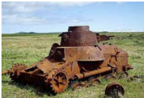
Подбитый японский танк Ха-Го на о. Шумшу (Северные Курилы).

мещалась ставка зловещего «Отряда 731», разрушило японские планы организации бактериологической войны.