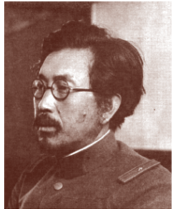
Сиро Исии, генерал-лейтенант медицинской службы японской армии – злой гений «Отряда 731». Сын помещика из префектуры Тиба, окончил Императорский университет в Киото, принадлежал к японской элите.

А вот другое высказывание генерала Исии: «В отличие от артиллерийских снарядов, бактериологическое оружие не способно мгновенно убивать живую силу, зато эти «невзрывающиеся бомбы» – снаряды, начиненные бактериями, – без шума поражают человеческий организм и животных, принося медленную, но мучительную смерть. Производить снаряды не обязательно, можно заражать вполне мирные вещи – одежду, косметику, пищевые продукты и напитки, съедобных животных, можно распылять бактерии с воздуха. Пусть первая атака не будет массированной – все равно бактерии будут размножаться и поражать цели».