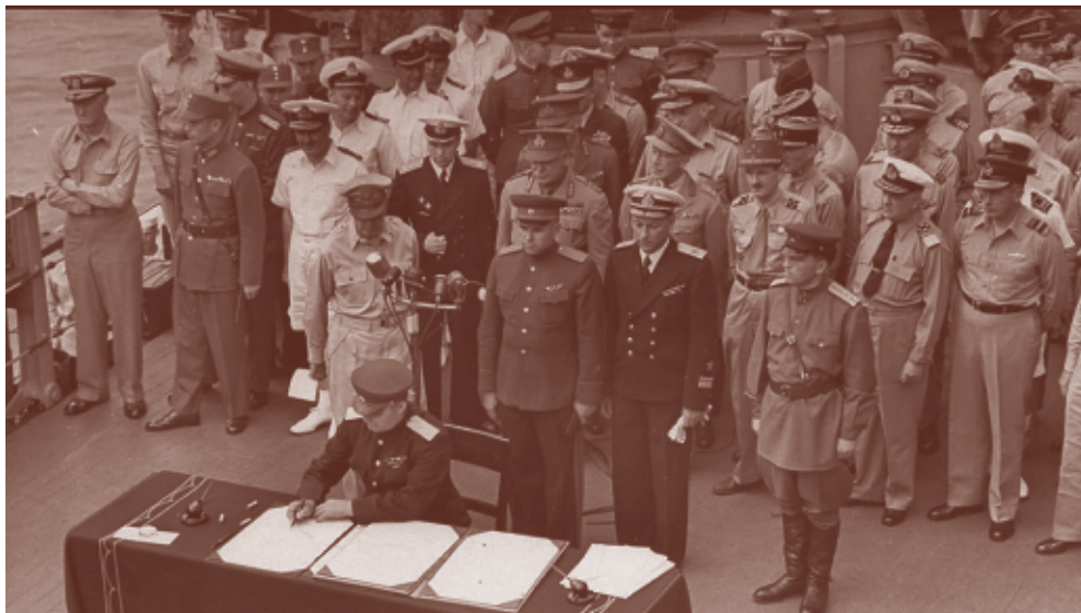
Генерал-лейтенант К.Н. Деревянко подписывает от лица СССР Акт о безоговорочной капитуляции Японии.

Теперь в России есть «памятная дата», которая, правда, перестала быть праздником победы над Японией, став календарной констатацией окончания войны – подписания представителями Японии (в присутствии союзников, включая и представителя СССР генерал-лейтенанта Кузьмы Деревянко) Акта о безоговорочной капитуляции на американском авианосце «Миссури» в Токийском заливе.