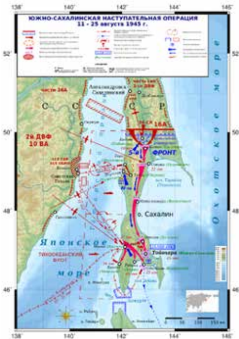
Южно-Сахалинская наступательная операция советских войск 11–25 августа 1945 г.

длилась 25 дней. В ходе военных действий была окружена и разгромлена Квантунская армия – самая сильная группировка войск Японии, освобождены Маньчжурия, Ляодунский полуостров, Северо-Восточный Китай, северная часть Кореи, южная часть Сахалина и Курильские острова.