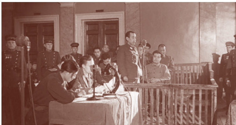
Подсудимый – генерал Ямада Отодзо, бывший главнокомандующий Квантунской армии, – произносит последнее слово. Хабаровск, 30 декабря 1949 г.

Таким образом, разгром Квантунской армии перечеркнул последние призрачные шансы Японии на затягивание войны. Кроме того, единый фронт союзников вынуждал отказаться от попыток играть на противоречиях между США и СССР и заключить сепаратный мир вместо безоговорочной капитуляции.