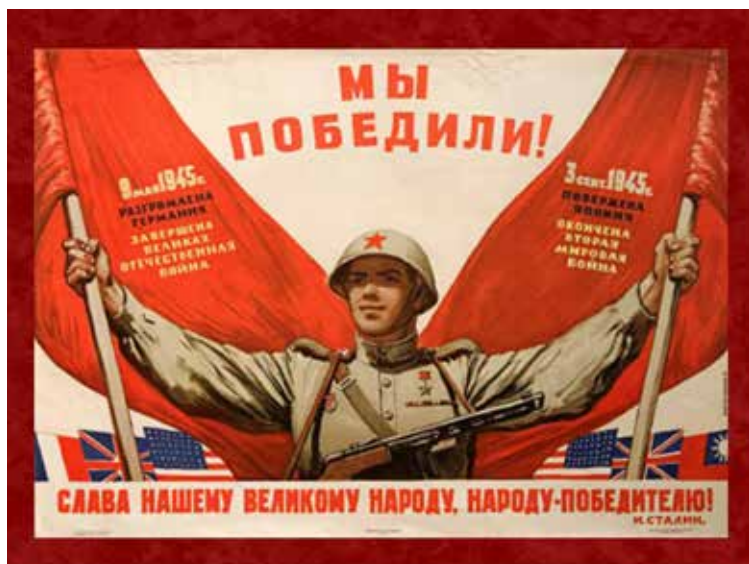
Плакат в честь Победы СССР над Германией и Японией в 1945 г.