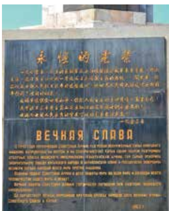
Надпись на монументе, посвященная советским воинам.