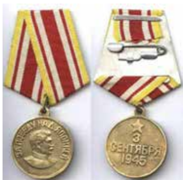
Медаль «За победу над Японией».

В честь победы над Японией была учреждена медаль, аналогичная медали за победу над Германией с той разницей, что профиль генералиссимуса смотрел на Восток, а не на Запад.