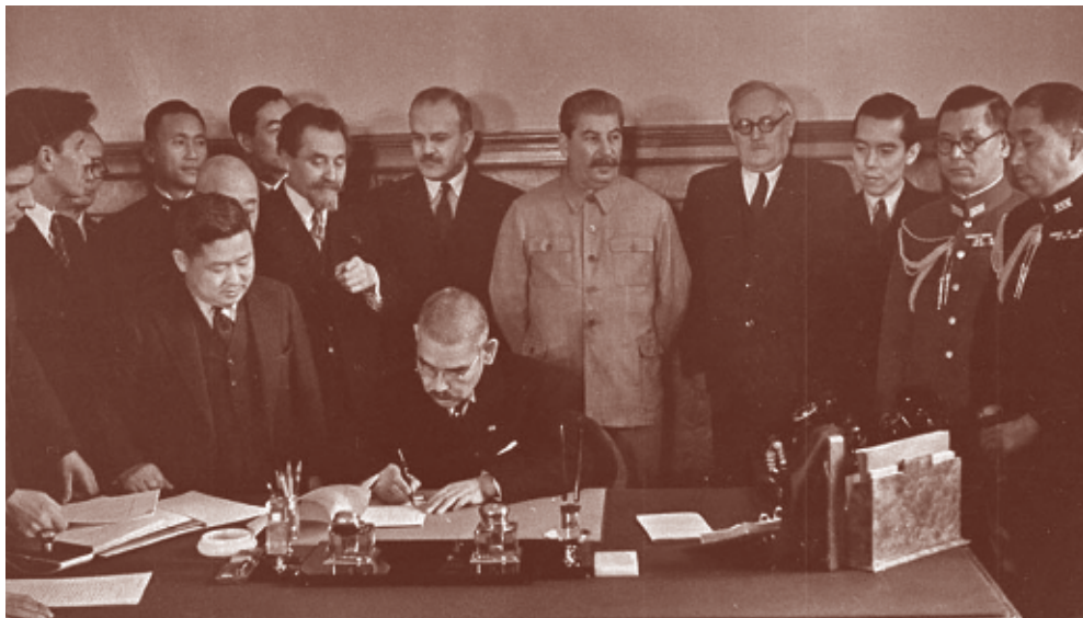
Подписание пакта о нейтралитете между СССР и Японией. Со стороны СССР договор подписал В.М. Молотов, со стороны Японии – министр иностранных дел Ёсукэ Мацуока и посол Японии в СССР Татекава.

ной Азии и островов Тихого океана. На монголо-маньчжурской границе японская армия была разбита в августе, а перемирие стороны подписали 15 сентября. Именно Халхин-Гол стал началом полководческой карьеры Георгия Жукова.