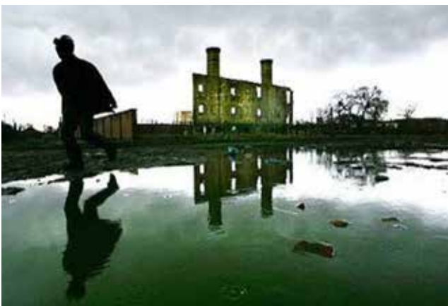
Отряд 731. Руины четвертого корпуса (современный вид).

«Отряд 731» был сформирован под названием «Управление по водоснабжению и профилактике частей Квантунской армии», на самом же деле его целью были крупномасштабные эксперименты и исследования в области бактериологического оружия.