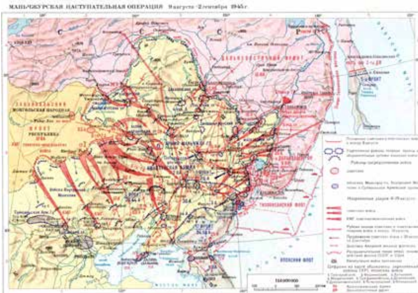
Маньчжурская наступательная операция 9 августа – 2 сентября 1945 г.

длилась 25 дней. В ходе военных действий была окружена и разгромлена Квантунская армия – самая сильная группировка войск Японии, освобождены Маньчжурия, Ляодунский полуостров, Северо-Восточный Китай, северная часть Кореи, южная часть Сахалина и Курильские острова.