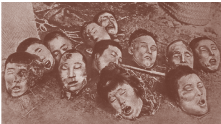
Жертвы нанкинской резни.

Япония осуществляла свою экспансию исключительно бесчеловечными методами. Так, в Китае после захвата Нанкина (1937 год) японцы за 6 недель расстреляли, закопали заживо, закололи штыками и обезглавили мечами 300 тысяч военнопленных и мирных жителей 21 .