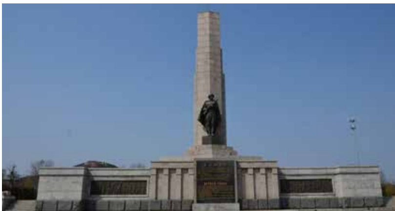
Монумент советским воинам в Китае, г. Люйшунь (Порт-Артур).