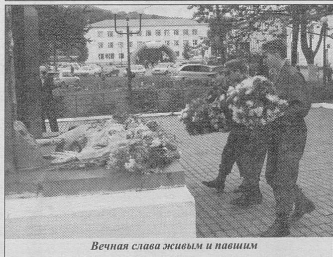
Вечная слава живым и павшим

небольшой праздничный концерт с песнями о Победе, такой долгожданной и трудной. В концерте приняли участие и самодеятельные артисты из новского Дома культуры.