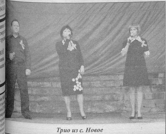
Трио из с. Новое