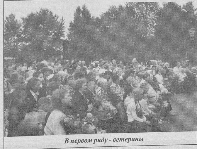
В первом ряду - ветераны