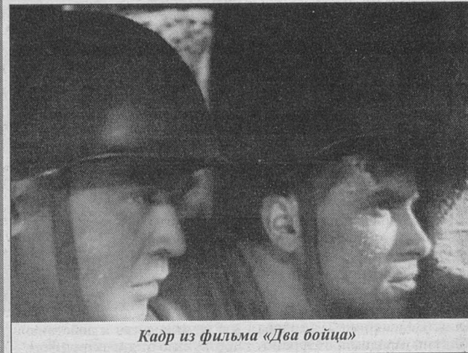
Кадр из фильма «Два бойца»

Особую популярность в годы войны приобрел кинематограф. Отечественные операторы и режиссеры фиксировали важнейшие события, происходившие на фронте, снимали документальные («Разгром немецких войск под Москвой», «Ленинград в борьбе», «Битва за Севастополь», «Берлин») и художественные фильмы («Зоя», «Парень из нашего города», «Наше