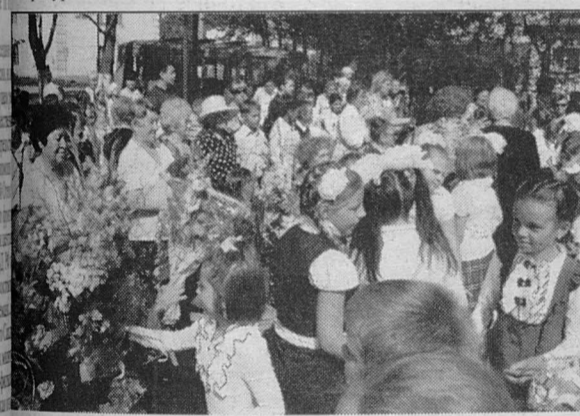
Цветы ветеранам от школьников

Несмотря на будний день, у стелы Славы было многолюдно. Собрались учащиеся всех школ МО «Макаровский городской округ», ветераны, сотрудники администрации и просто неравнодушные люди. Ветераны в этот день принимали поздравления от мэра МО «Макаровский городской округ»