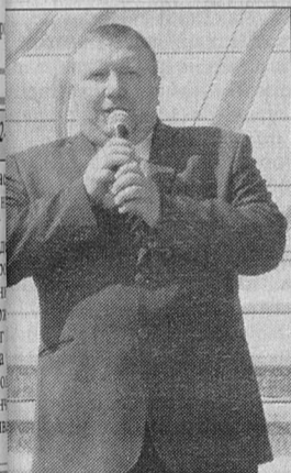
Поздравление от мэра

2 сентября на городской площади прошла уже традиционная общегородская линейка, посвященная Дню знаний. В этом школьная семья города Макарова пополнилась на 80 первоклассников.