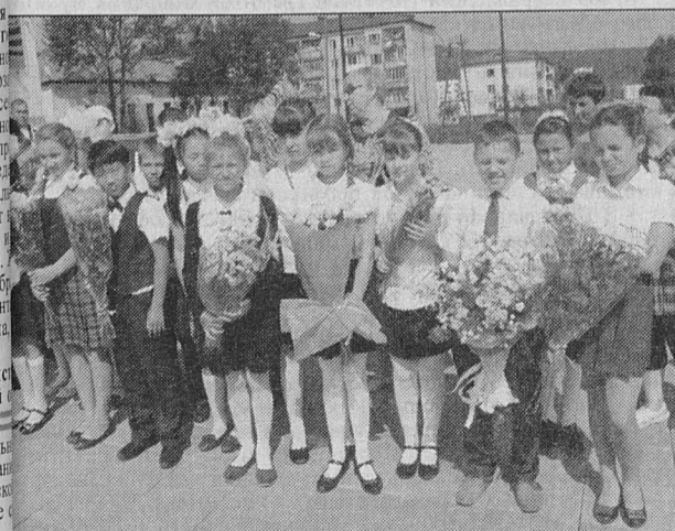
5 класс школы № 2