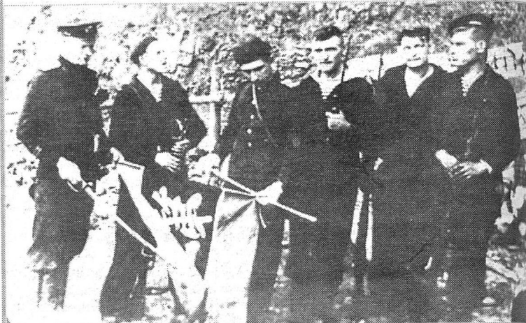
Матросы-тихоокеанцы с трофейным японским флагом на освобожденном Южном Сахалине, 1945 год.

Выгрузку произвели за 18 часов, после чего «Самарканд» с помощью морского буксира вывели из порта кормой вперед, т.к. акватория не позволяла судну развернуться. Вслед за «Са-