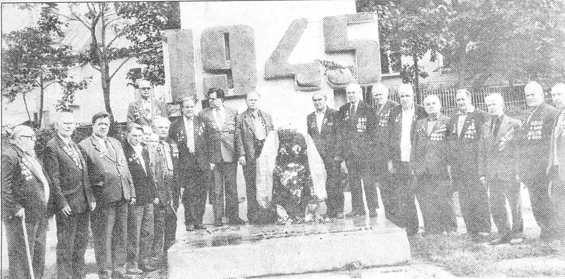
бойцы 113-й Сахалинской отдельной стрелковой бригады в с. Крабовоздском на о. Шикотан у памятного знака в честь победы советского народа в Великой Отечественной войне (сентябрь 1990 г.)