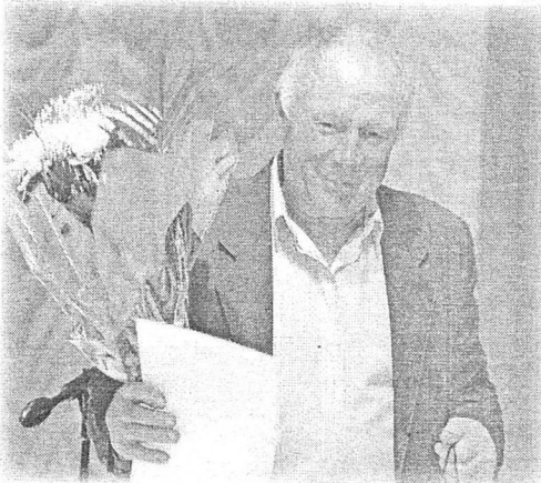
Торжественное собрание по случаю профессионального праздника - Дня работника нефтяной и газовой промышленности и Дня города состоялось 3 сентября. Эти праздники любимы всеми охинцами, они касаются каждого и потому объединяют всех. В этом - их смысл и их сила. Нефтяникам - молодым и ветеранам отрасли - пожелали новых свершений и производственных побед, здоровья, благополучия