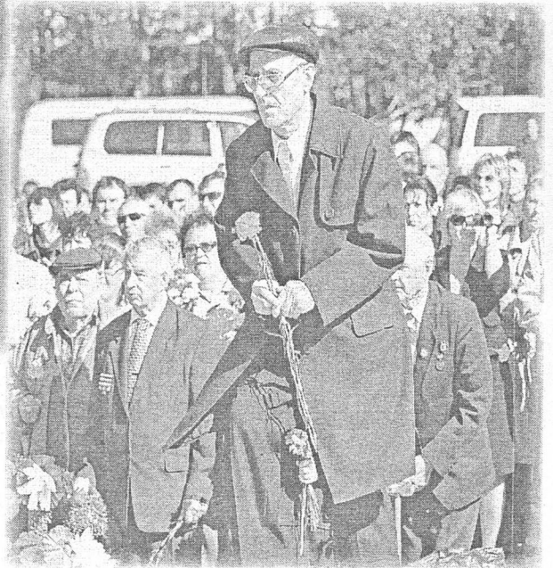
Завершилось мероприятие возложением венков и цветов к Вечному огню