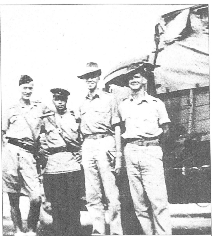
● Рядом с советским офицером освобожденные из японского плена англичанин (слева) и двое австралийцев (крайние справа). В конце войны японцы ослабили режим в лагере для военнопленных, им разрешили получать посылки, в частности, от Красного Креста. Потому они выглядят, так сказать, вполне презентабельно.

На Западе, особенно в США, можно услышать, будто Япония капитулировала не из-за вступления СССР в войну, а из-за американских атомных бомб, сброшенных на Хиросиму и Нагасаки. Если бы это было так, то участники