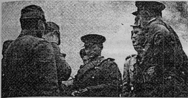
Переговоры победителей и побеждённых

Доставившие нас суда стояли на якорях в двух-трех километрах от берега. Пушки, минометы, автомашины, лошади, повозки, ящики с боеприпасами и прочие грузы приходилось перегружать из приютов на трофейные японские катера и баржи, доставлять до берега и вручную выгружать на пирс.