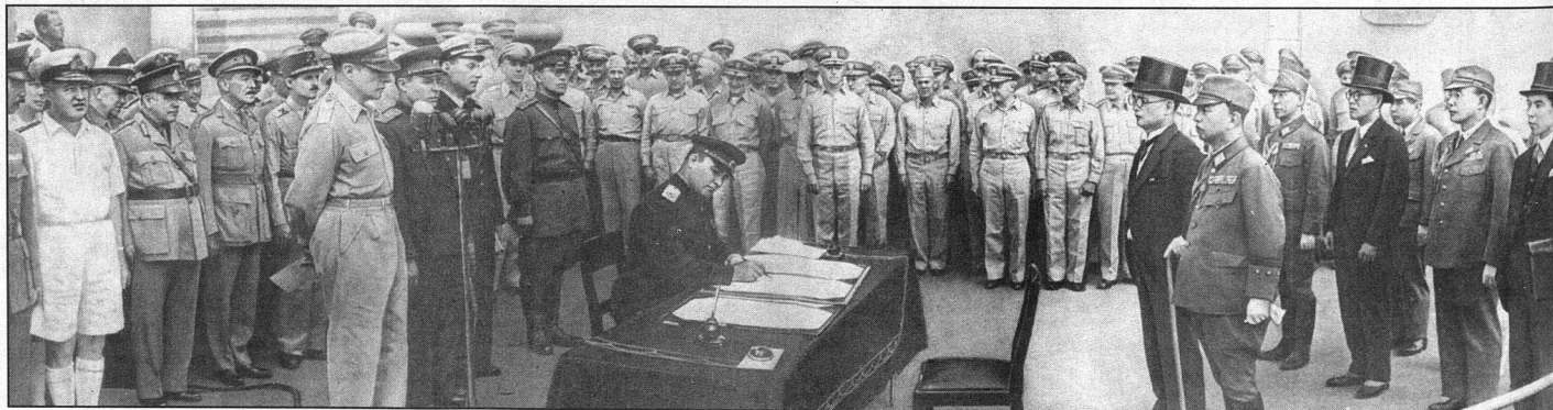
Исторический момент — милитаристская Япония пала!