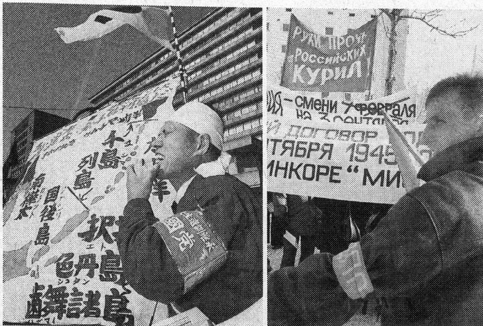
Японские сторонники возврата «северных территорий» и российские противники передачи Южных Курил Японии не позволяют Москве и Токио достичь компромисса по территориальному вопросу.

Глава МИД России Сергей Лавров провел в Токио переговоры, целью которых стала подготовка визита в Японию российского президента Владимира Путина. Господин Лавров мало чем порадовал японцев — он даже не сообщил им точные сроки давно обещанного визита президента Владимира Путина. К тому же министр предельно жестко заявил, что в споре о Южных Курилах две стороны придерживаются противоположных позиций. Впрочем, японцы были рады уже тому, что визит российского президента все же состоится до конца года. С подробностями — корреспондент ИТАР-ТАСС в Токио ВАСИЛИЙ ГОЛОВНИН , специально для „Ъ“.