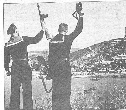
● Моряки-тихоокеанцы в освобожденном Порт-Артуре.

Однако разгром японских войск на реке Халхин-Гол в августе 1939 года заставил Японию отказаться от своих планов захвата Монголии и части советских земель. Переговоры с министром иностранных дел Японии Мацуока в апреле 1941 года, в которых участвовал Сталин, увенчались подписанием советско-японского пакта о нейтралитете и декларации о взаимном уважении, территориальной целостности и неприкосновенности границ Монгольской Народной Республики и Маньчжоу-го. Так были сорваны расчеты Германии и США стянуть СССР в войну с Японией.