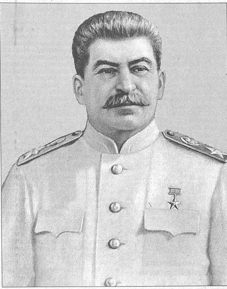
Слава нашему великому народу, народу-победителю! Вечная слава героям, павшим в боях за честь и победу нашей Родины! Пусть здравствует и процветает наша Родина!

Обращение И.В. Сталина было опубликовано в «Правде» 3 сентября 1945 г. Этот текст опубликован и издан массовым тиражом.